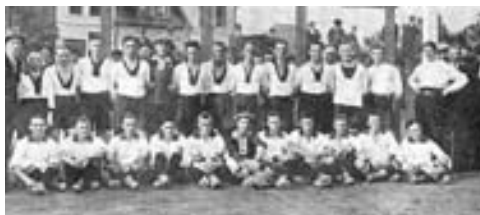
první mužstvo DSV se svým místním rivalem RSK v roce 1919

zal. 1919 jako DSV Reicheberg klubové barvy: modrá-bílá