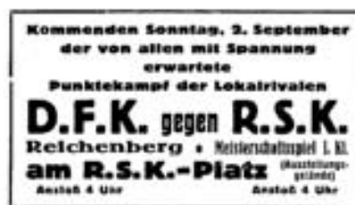
pozvánka na místní derby